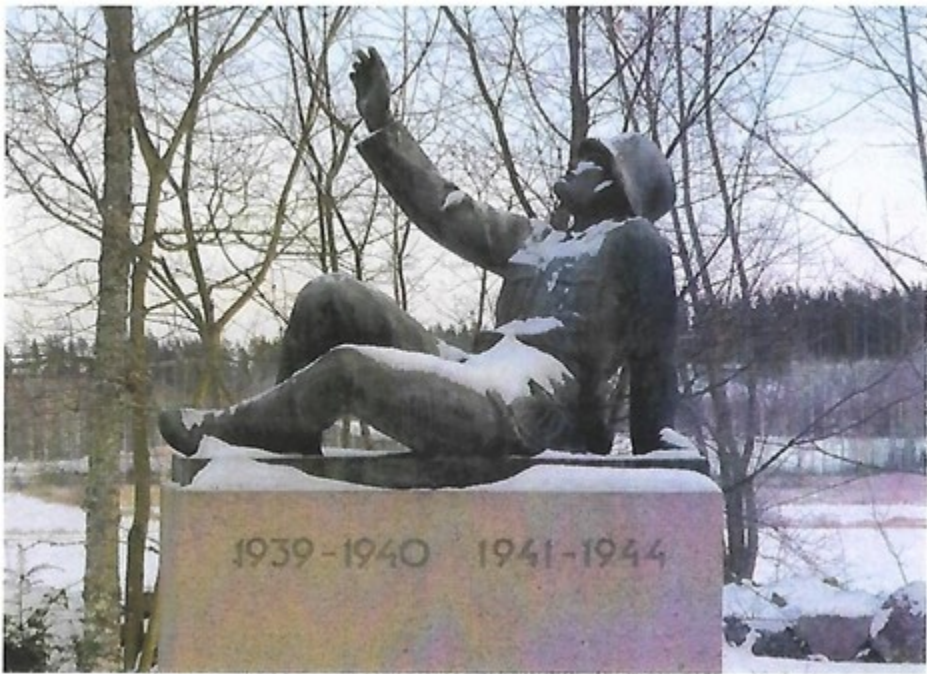
Sammattilaisten nimi sankaripatsaallemme: Usko tulevaisuuteen