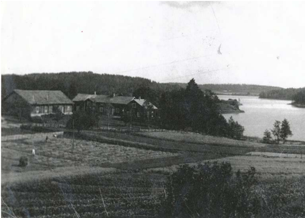
Kuva 6: Näkymä Leikkilästä Kirmusjärvelle Piekan talon kohdalta 1900-luvun alkupuolella

Tätä ajurien pitkälle kehittyntä kalastustaitoa ja kalojen ahdinkotilaa ovat ainakin Kirmusjärven rannoilla asuneet kalastaja entisaikaan äkänneet käyttää hyväkseen. Syksyllä jo ennen kuin ajolinnut saapuivat tehtiin eri kohtiin ssaarten, nienten, lah-tien jne. kivikkorannoille veteen, koskeloiden mahdollisiin apajapaikkoihin ns. röy-syjä .