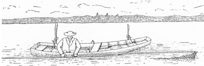
Kuva 8 - Verkko laskuvalmiina

lastaja ottaa esille verkon ja laskee sen sinänsä puikkarissa ollen veteen sille puolelle, jolla kerput ovat. Itse hän laskeutuu polvilleen ruuhen laidalle. Nyt ottaa hän esille toisen saiton ja pistää sen kärjen verkon ensimmäiseen tuohikipperään. (Saiton kärkeen on jätetty pieni oksa tai on se niin veistetty, ettei se saata painua liian syvälle kipperään, estyen siten tarttumasta lujasti kiinni.) Toisella kädellä puikkarista pidellen sekä tällä että toisella kädellä saittoa hoidellen työntää hän tätä nyt sivullepäin ruuhen laidan suuntaan, jolloin samalla verkko kehkeytyy puikkarista puoliväliin saakka. Kun tämä on tehty, asettaa hän saiton pään jalan alle tai pitelee saittoa muuten sivulle päin työnnettynä. Nyt hän vetää jäljellä olevan osan verkkoa pois puikkarilta sekä asettaa sen varovasti ruuhen laidalle riippumaan. Tämän jälkeen hän tarttuu toiseen saittoon, sovittaa sen kärjen verkon toiseen äärimmäiseen kipperään ja työntää saittoa sivulle päin ruuhen laidan suuntaan, mutta päinvastaiseen kuin edellisellä kerralla. Näin kehkeytyy verkko varovasti pidellen sekaantumatta ja on pian levitettynä laskuvalmiiksi. Kalastaja tarttuu nyt kummankin saiton päähän, nykäisee niitä äkkiä itseänsä kohden, jolloin kipperät heltiävät saittojen kärjistä ja verkko laskeutuu pohjaan juuri kerppujen päälle. Laskeminen tapahtuu illalla, nostaminen aamulla tavallisen tapaan.