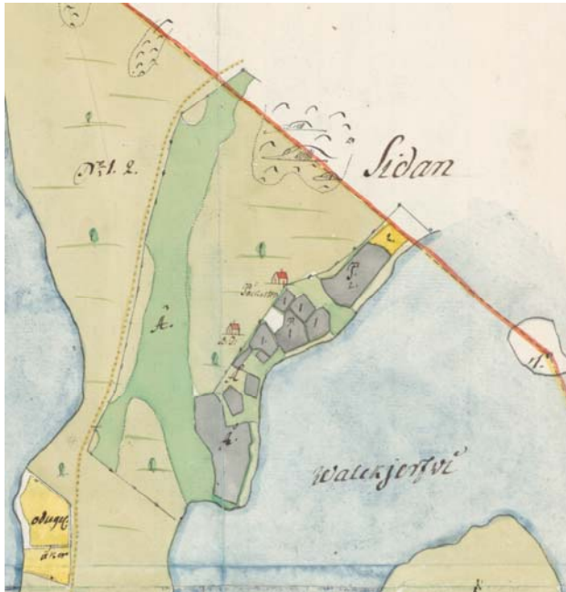
Kuva 2 - Pokan torppa vuoden 1776 isojaon karttaotteessa

Luskalan kartanolla säterikartanona oli ennen muita sammattilaisia tiloja oikeus perustaa torppia. Luskalan kartanon alueelle perustettiinkin 1750-luvun lopussa ensimmäinen Sammatin torpista. Torpan nimi vaihtelee alkuvaiheessa, mutta vakiintuu myöhemmin Pokka-muotoon. Aikaisempia kirjoitusasuja ovat Påkala, Påcka ja Pocka. Torppa perustetaan Valkjärven ja Ruokjärven väliselle kannakselle ja torppari vaihtuu aluksi tiuhaan tahtiin. Torppa esiintyy isojaon kartoissa (ks. Kuva 2).