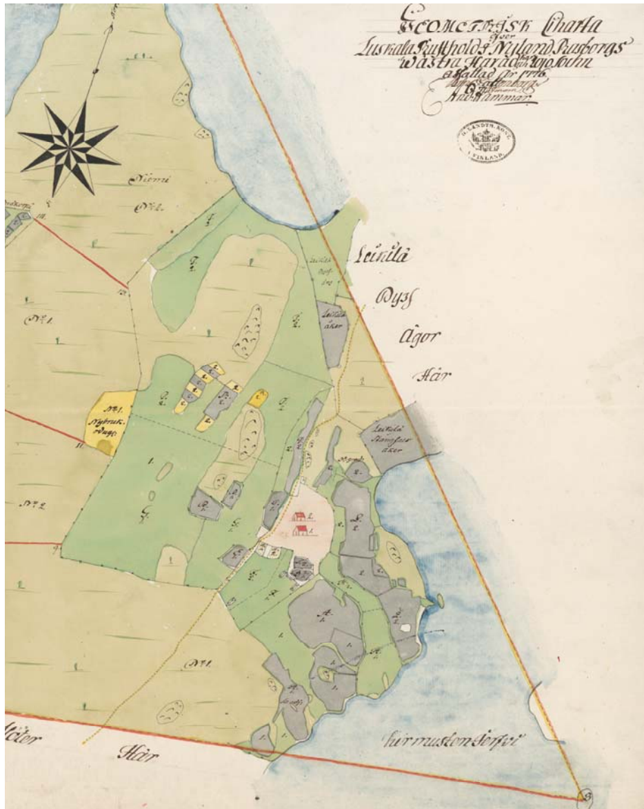
Kuva 1 - Ote Luskalan isojaon kartasta vuodelta 1776. Talo nro 1 on Löfkulla ja talo nro 2 Alitalo.